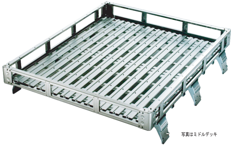
写真はミドルデッキ

ステンレスボディで、コーナー部まで使いきる効率の良い積載性能が特徴。 ラック長を6タイプ、ラックボディ高を2タイプ用意しました。 ベーシックモデルにふさわしいルーフラックです。